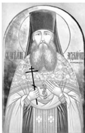
Прпмч. Ардалион (Пономарев)

Родители о. Григория и м. Нины Пономаревых прославлены в лике святых в 2006, 2008 гг.